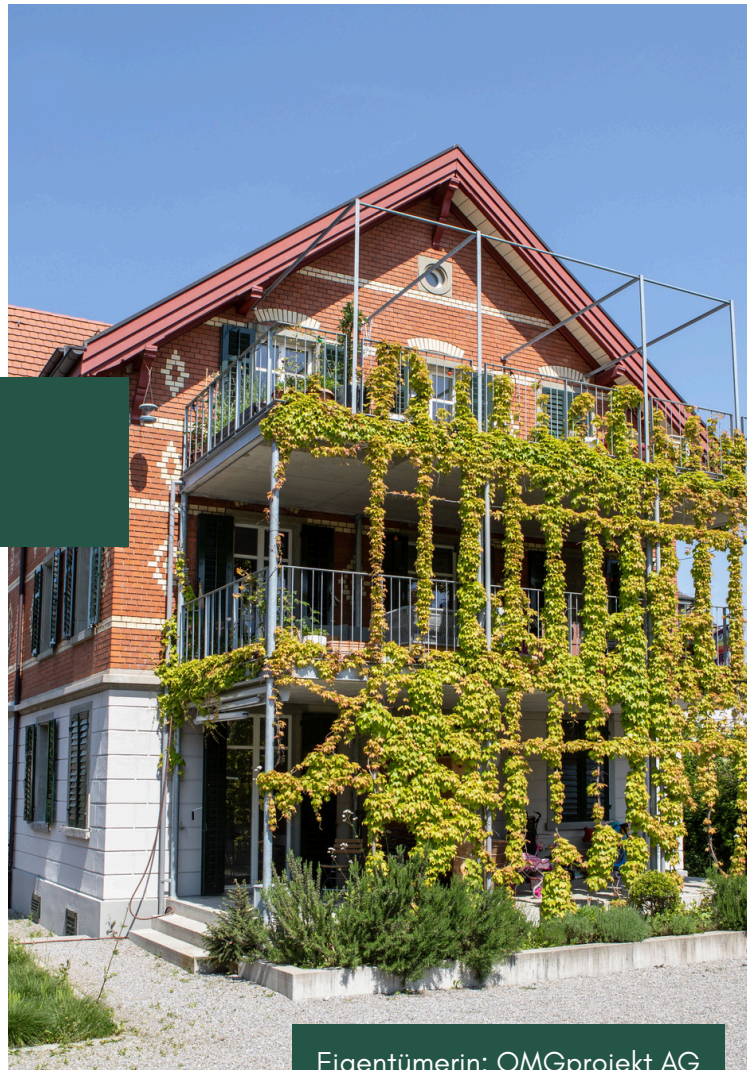
Eigentümerin: OMGprojekt AG

Der nördliche Teil des Gewerbegebäudes hatte eine gute Substanz, die wir weiterhin gewerblich nutzen wollten – in unserem Fall als Ateliergebäude. Der Hauptzugang aufs Grundstück im Westen wurde durch den denkmalgeschützten Altbau prominent markiert. Und auf dem freigestellten, südlichen Areal konnte ein neues Mehrfamilienhaus entwickelt werden. Die Anordnung der drei Gebäude um einen gemeinsamen Hof wurde zur tragenden Projektidee.